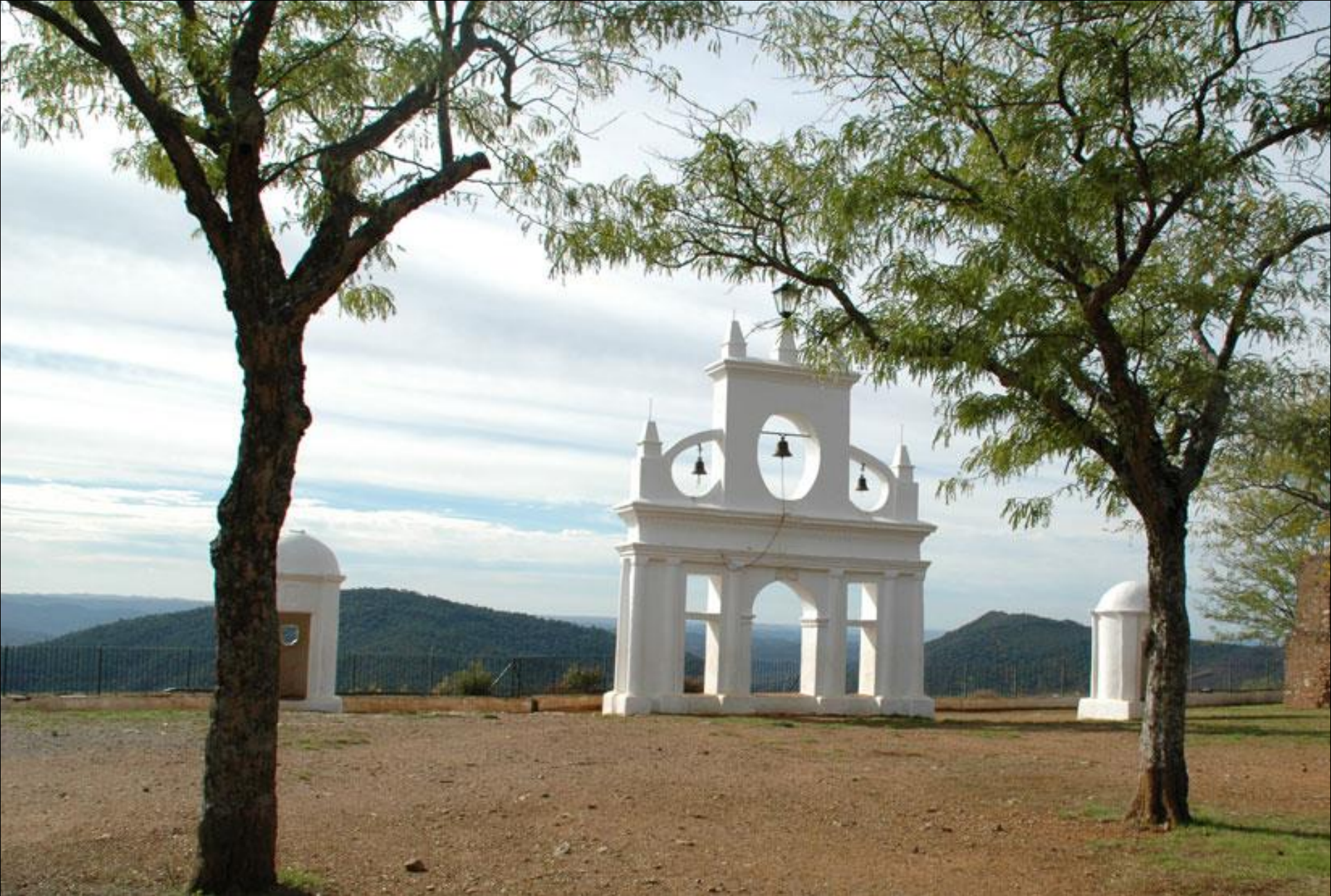
Peña de Arias Montano, Puerta de Alajar, una de las mejores dehesas de bellotas