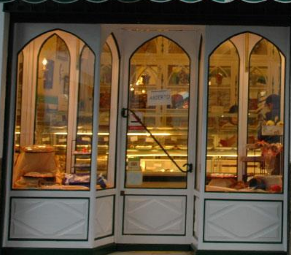
Confitería Rufino, una de las 'instituciones' de Aracena desde 1875